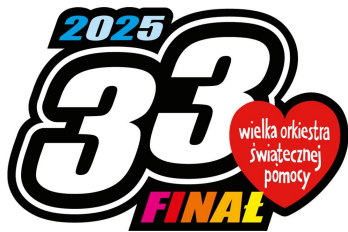
Zał. 1 Logotyp 33. Finału WOSP